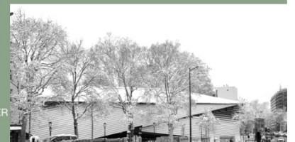
MUSEE ALBERT KAHN 2021 . CHANTIER