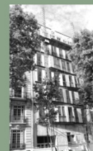
SIEGE SOCIAL PRONY 2017 . CHANTIER