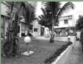
OXFAM'S VOLUMES 2006