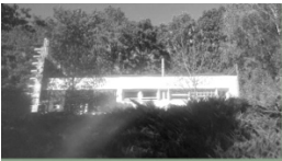
MAISON B. 1985