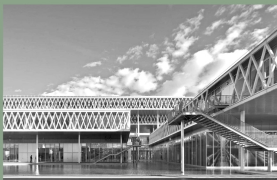
ARCHIVES NATIONALES 2014 . CHANTIER