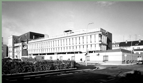
HÔTEL DU TRESOR 1995