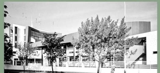
SAMU DE L'HÔPITAL AVICENNE 1994