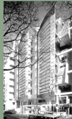
IMMEUBLE COUPLE-PLUS 1996