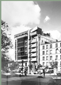
LES PALMES D'ITALIE 1988