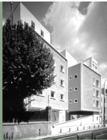
IMMEUBLES GRAND-PIED 1990